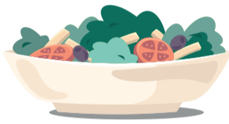
Ólej ze salátu