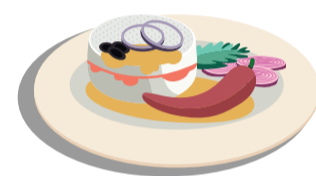
Olej z nakládaných potravín