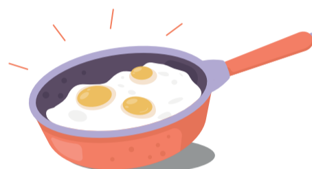
Olej ze smažení